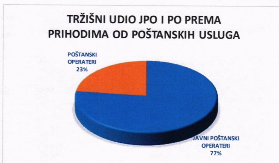
Дијаграм 1. Тржишни удио ЈПО И ПО у 2022. години према приходима од поштанских услуга