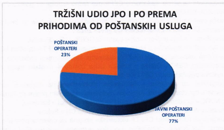
Dijagram 1. Tržišni udio JPO i PO u 2022. godini prema prihodima od poštanskih usluga