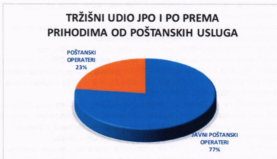
Dijagram 1. Tržišni udio JPO i PO u 2022. godini prema prihodima od poštanskih usluga